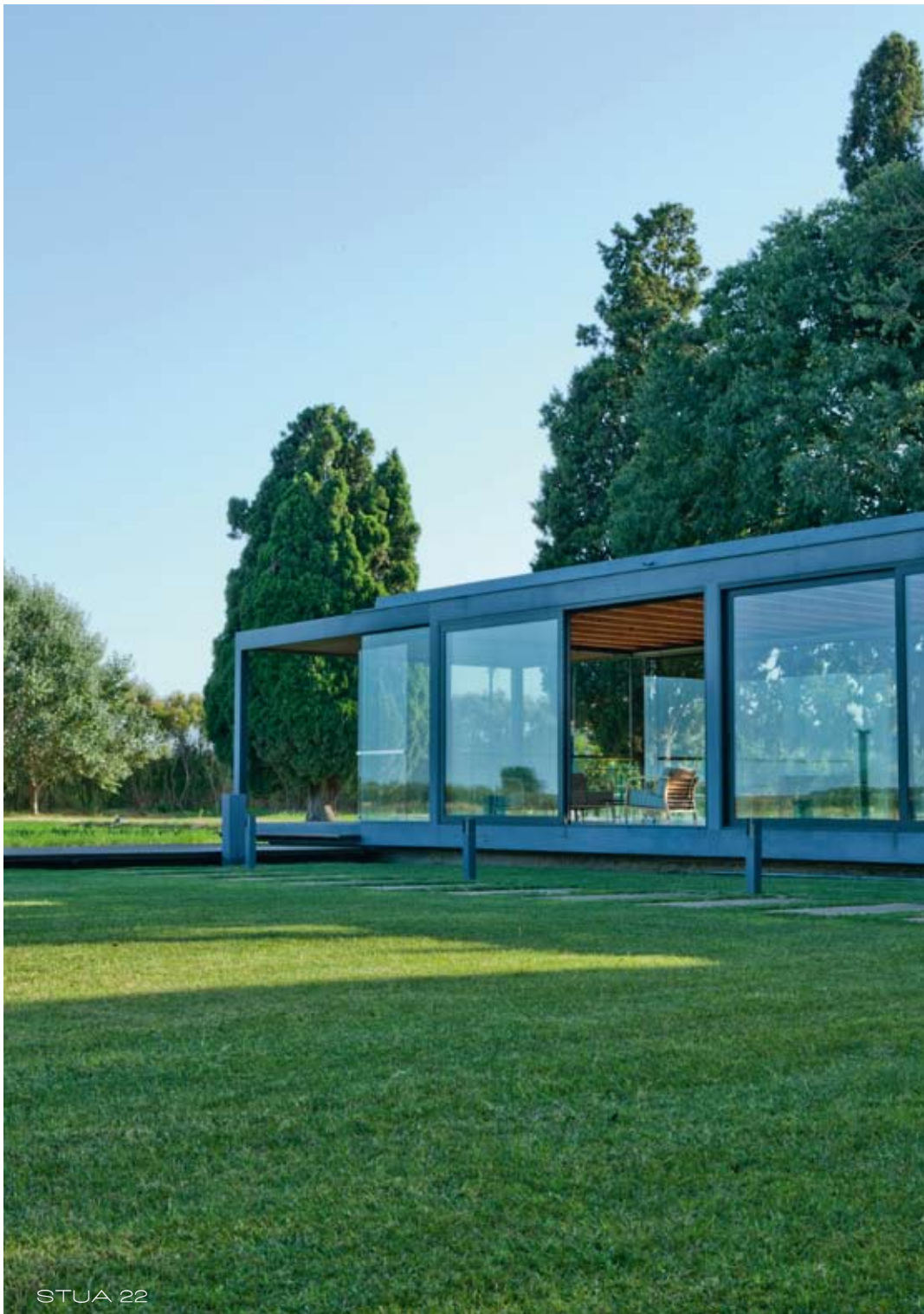
MOLI DEL MIG HOTEL JOSEP MARIA DEULOFEU ARCHITECT GIRONA