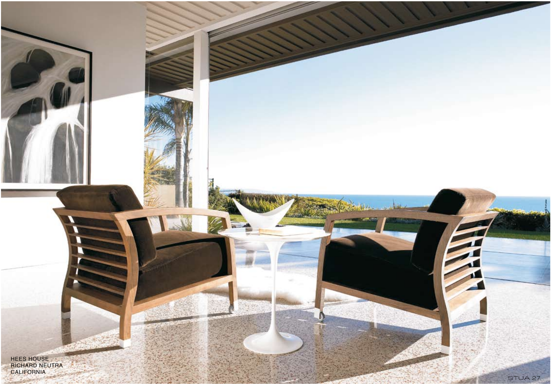
HEES HOUSE RICHARD NEUTRA CALIFORNIA